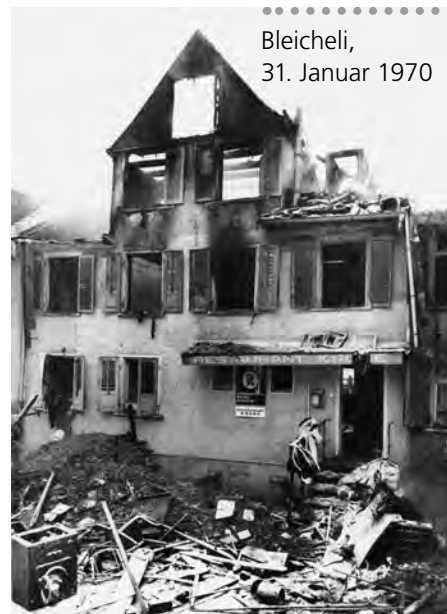
Bleicheli, 31. Januar 1970