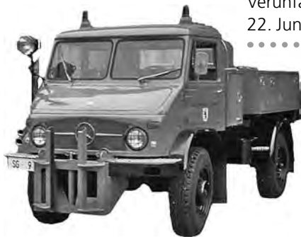
Verunfallter Unimog, 22. Juni 1986