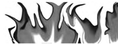
Sankt Florian Schutzpatron der Feuerwehr