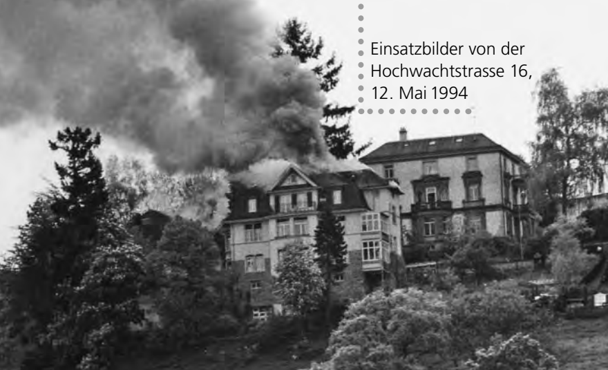
..... Einsatzbilder von der Hochwachtstrasse 16, 12. Mai 1994 .....