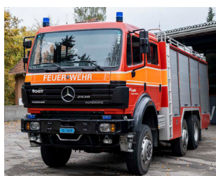
TLF der Kompanie West