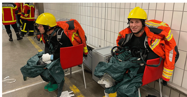
Sicherungstrupp im Vollschutzanzug

parallel auf drei Etagen gleichzeitig eingesetzt werden. Durch die Ablösungen der Trupps, inklusive des bereitstehenden Reservetrupps, war beinahe das gesamte Vollschutzmaterial im Einsatz. Dank der Ortsfeuerwehr mit ihren hervorragenden Gebäudekenntnissen und den immer verfügbaren Betriebsmitarbeitern war der immer grösser gewordene Einsatz doch um 22.45 Uhr für St.Gallen fertig. Damit hätte ich um 12.15 Uhr überhaupt nicht rechnen wollen.