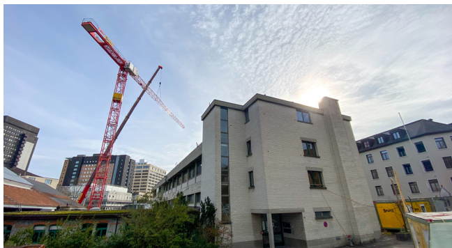
Baukran beim N44

Am Montag, 24. Oktober 2022 war dann der lang ersehnte Baustart. Nun galt es für die Handwerker die ganze Baustelleneinrichtung zu erstellen, Baukran stellen und vieles mehr.